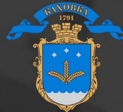
герб г. Каховка